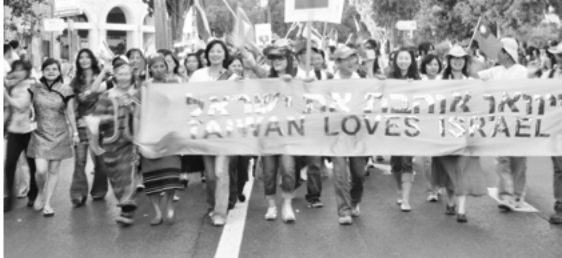
住棚節的耶路撒冷遊行：台灣與列國教會一起公開表達對以色列的愛。

神的呼召是漸進式地臨到我。還記得幾乎是19年前，神第一次對我說到詩篇48:12-14：「你們當周遊錫安，四圍旋繞，數點城樓，細看她的外郭，察看她的宮殿，為要傳說到後代……。」我毫不猶豫地說，我去！去玩有什麼難的？之後在服事中，因著牧長對以色列的負擔，我竟開始帶以色列代禱團！2004那一年的代禱中，神清楚用撒迦利亞書14:16-19