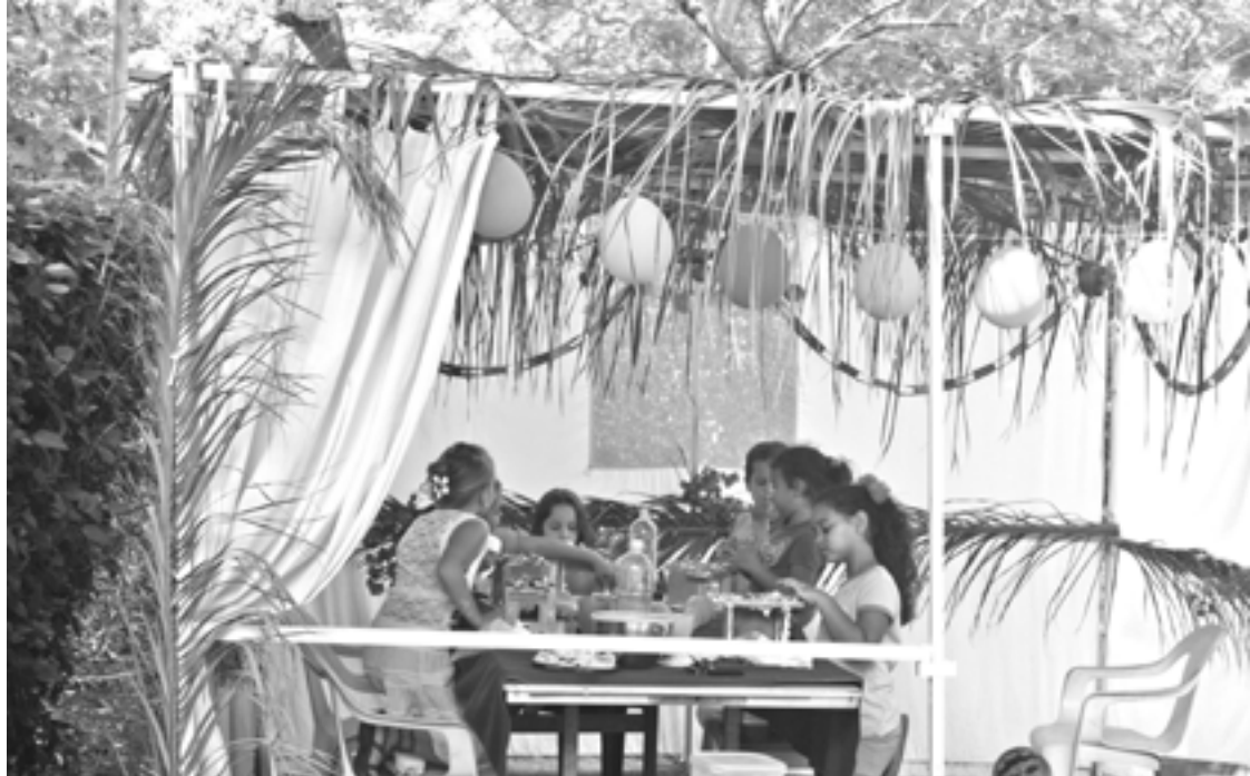
在順服主吩咐而搭建的住棚節棚子裡，孩子們正歡慶著生日。

我試著想像先祖們隨著摩西走過荒涼、崎嶇的曠野往南行。我數年前曾經參訪那地，和信耶穌的阿拉伯及猶太信徒，一起坐在過去可能是西奈山的地方看日落。地勢相當險峻，全是岩石。從每個角度看過去，都是巍峨壯觀的高山，幾乎看不到植物。我的生活相較之下，簡直每天都在郊